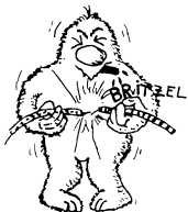
Abbildung 1: Dies ist ein Bild von Britzel, wie er einen Kurschluss verursacht.

\begin{figure}[htb] \includegraphics[height=2.5cm]{ bilder/britzell.pdf} \label{fig:britzell} \caption[Britzellbär]{Dies ist ein Bild von Britzell, wie er einen Kurschluss verursacht.} \end{figure} In Bild~\ref{fig:britzell} kannst du unseren Britzell sehen.